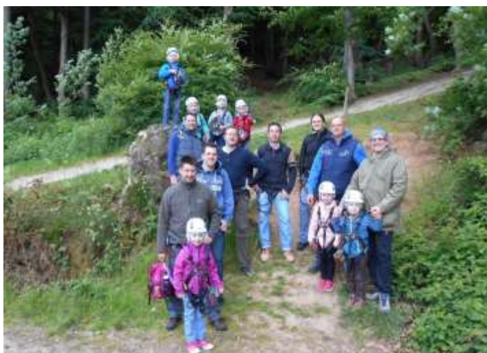
Die großen und kleinen Kletterer erlebten einen spannenden Tag im Kletterpark Bad Neuenahr.