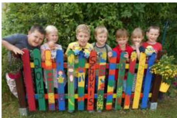
Ein bunt bemaltes Zaunelement haben die kommenden Erstklässler der Kita Werthhoven als Abschiedsgeschenk überreicht.

Wachtberg-Werthhoven - Bei strahlendem Sonnenschein, zu Kaffee und Kuchen, mit Eis und Erdbeeren, luden die kommenden Erstklässler mit ihren Eltern in den Garten der „Kita Maulwurfshügel“ ein.