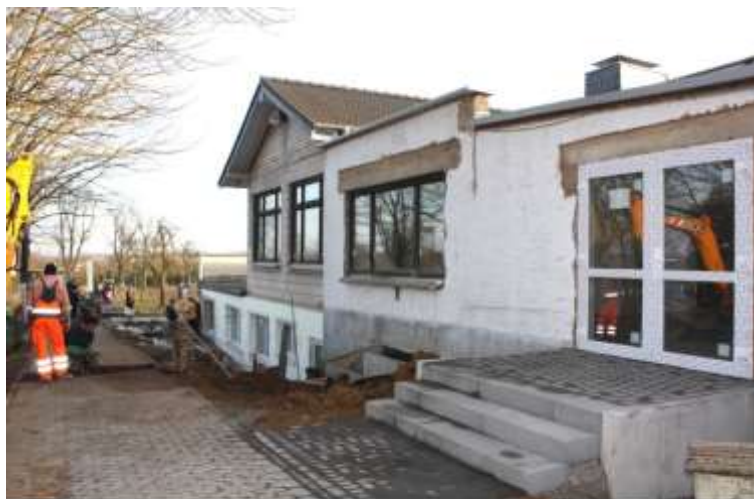
Der Haupteingang des Pössemer Treffs ist jetzt über drei Stufen und ein breites Podest gut zu erreichen.

Und das Ergebnis kann sich sehen lassen. Wer in den Jugendtreff möchte, erreicht nun trockenen Fußes dessen separaten Eingang im Souterrain über einen schön gepflasterten, leicht abfallenden Weg. Auch für den Haupteingang ist die Zeit des Provisoriums vorbei; drei Stufen und ein breites Podest laden jetzt zum Eintreten ein. Beide neuen Zuwege wurden dabei so angelegt, dass sie an den schon vorhandenen, am Gebäude entlang laufenden Fußweg angeschlossen werden