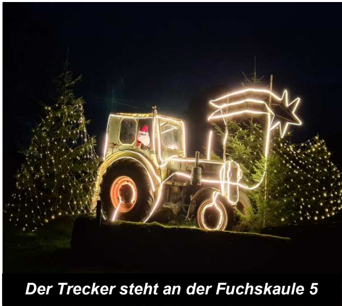
Der Trecker steht an der Fuchskaule 5

Aus einem Funken Hoffnung wird eine große Freude